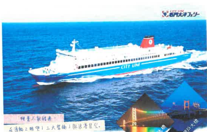
絕景不能錯過！ 在渡輪上眺望「三大架橋」與浪漫星空。

※本日若因航空公司或不可抗力因素，而變動航班時間及降落城市，造成團體行程變更或增加餐食或減少餐食，本公司不另行加價，亦不減價，敬請見諒。