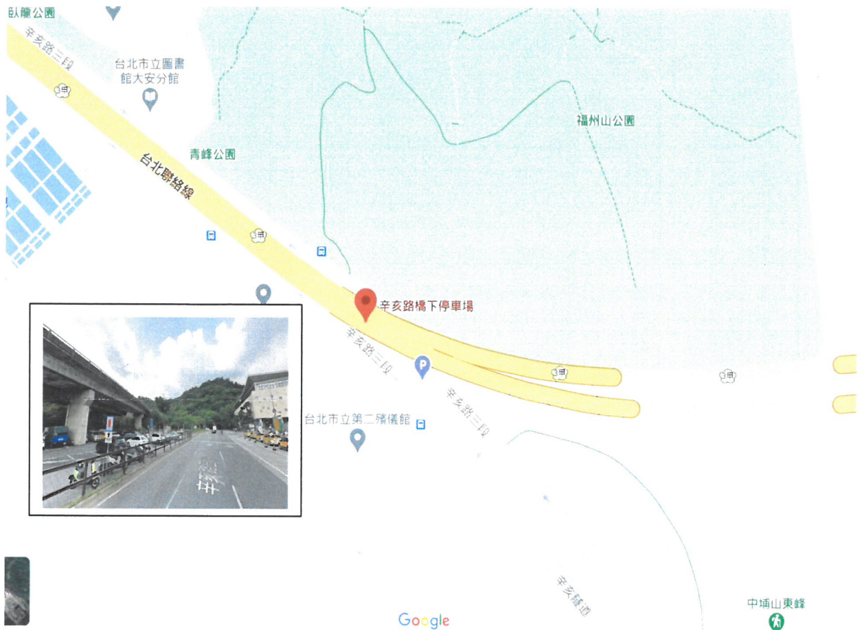
台北聯絡道辛亥路高架橋下停車場示意圖